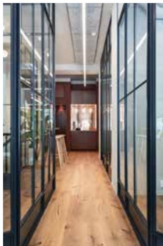
Pulverlackat i RAL 9016