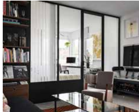
Vägg med plåt nedtill