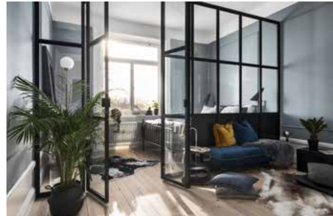
Vägg med plåt nedtill och dubbeldörrar