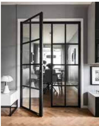
Dörr med tryckeshandtag och lås