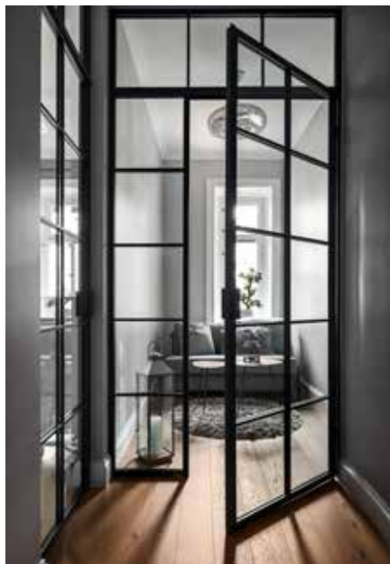
Dörr med L-handtag, sidoljus och överljus