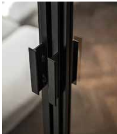
Dörrar med L-handtag