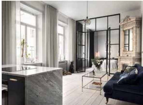
Vägg med dubbel dörr, sidoljus och överljus