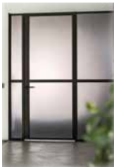
Gråtonat etsat glas