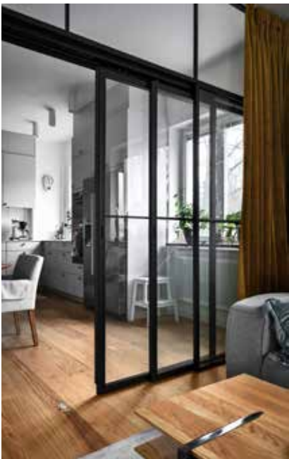
Skjuddörrar med överljus