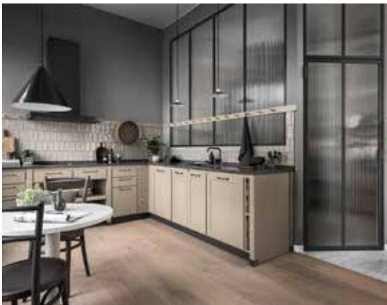
Glasväggar med linjeglas