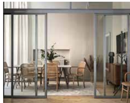
Vägg med överljus och två skjutdörrar. Pulverlackat i RAL 7047