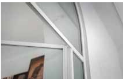
Pulverlackat i RAL 9016