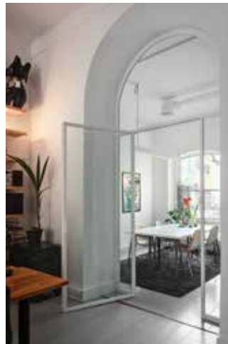
Pulverlackat i RAL 9016