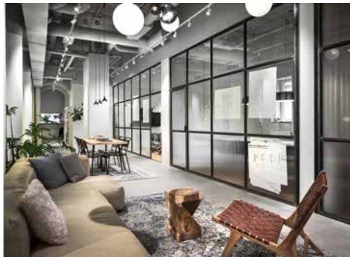
Väggar i kallvalsade profiler med klarlack och linjeglas nedtill.

I den moderna byggnationer är miljöaspekten en av de viktigaste parametrarna, därför har vi valt våra material utifrån så låg miljöpåverkan som möjligt. Vi har erfarenhet av certifiering Breeam, Well och miljöbyggnad guld.