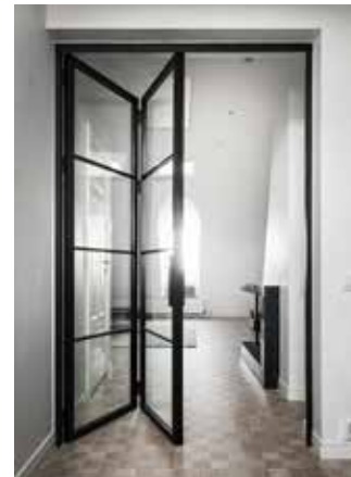
Vikdörr med skena upp till